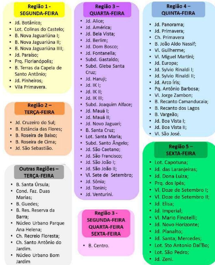
Figura 100 - Periodicidade da Coleta Seletiva.